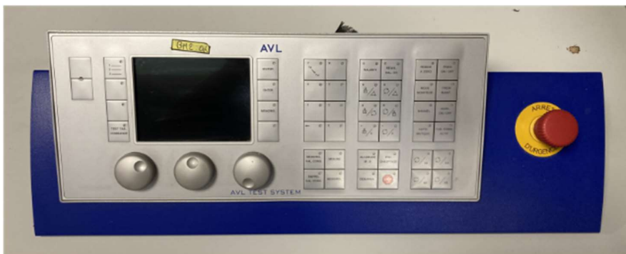
Figure 1- Vista frontal do equipamento.